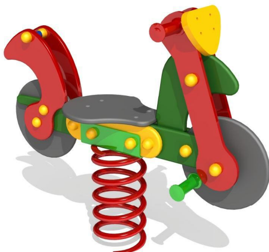
Rzut z góry